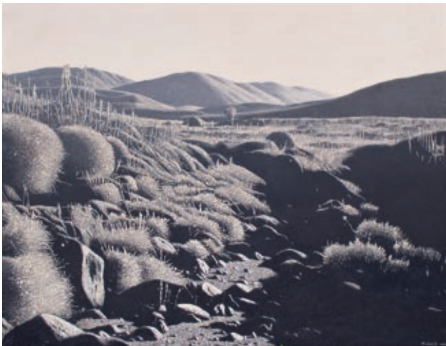
Straße des Königs | 2004 | Öl auf Leinwand | 140x180 cm