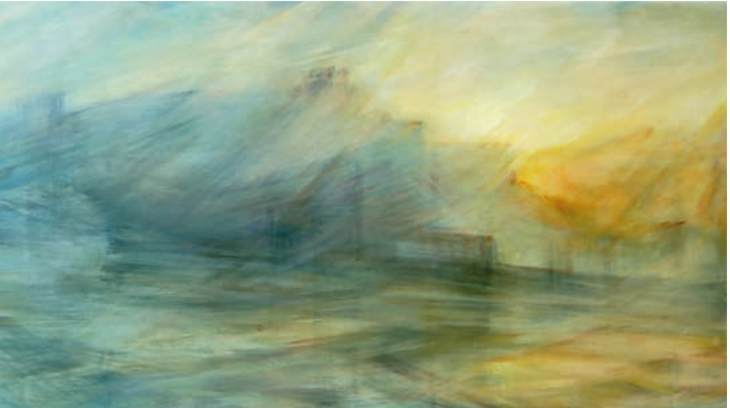
Festung | 2009 | Öl und Acryl auf Leinwand | 90x230 cm | VG Bild-Kunst, Bonn 2024

Andreas Bruchhäuser studierte ab 1981 bei Prof. Thomas Bayrle an der Städelschule Frankfurt und bei Prof. Rissa an der Kunstakademie Düsseldorf. 1986 zog er nach Koblenz. Seitdem ist er an Ausstellungen in ganz Deutschland beteiligt. Bruchhäuser lebt und arbeitet in Koblenz-Ehrenbreitstein.