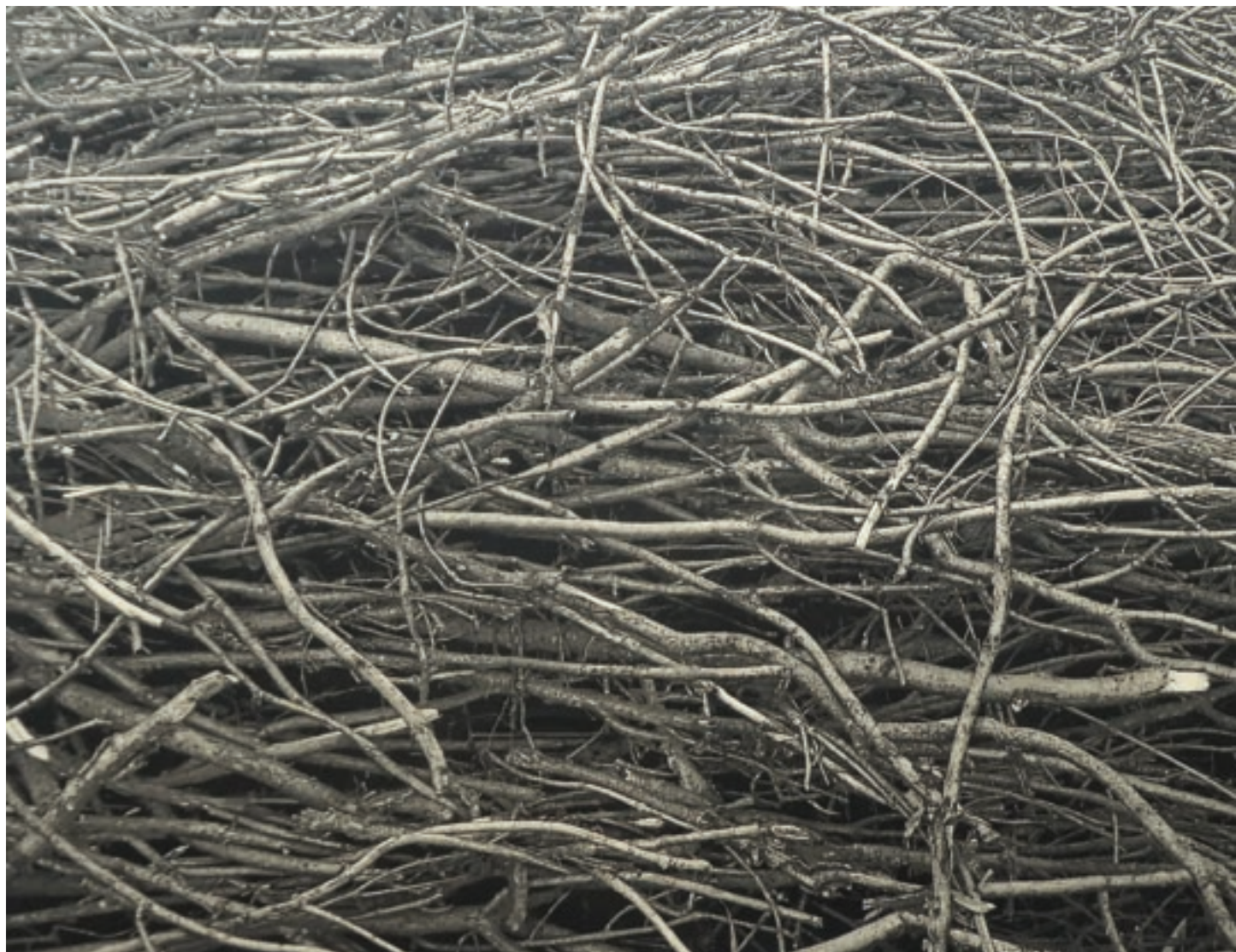
Reisig | 2022 | Radierung | 135x185 cm | Courtesy the Artist | Foto: Michael Rausch