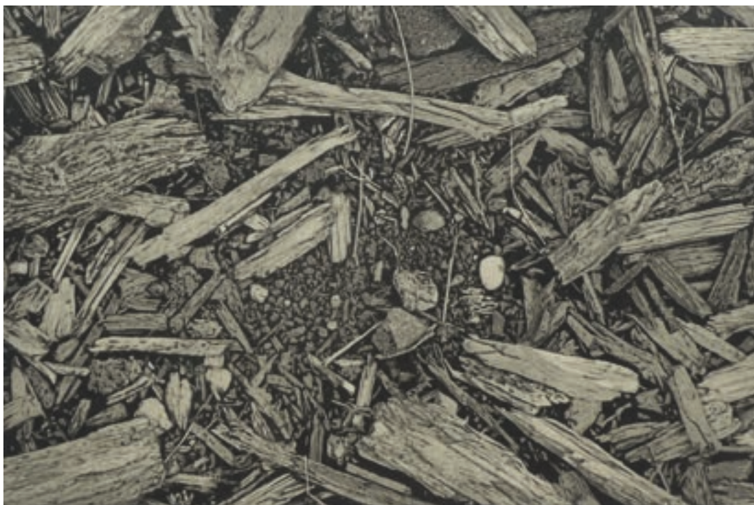
Bodenstück Treibholz | 2019 | Radierung | 24x36 cm

Rauschs Radierungen lenken den Blick gen Boden. Nur wenige seiner Werke lassen Himmel oder Horizont erblicken. Er richtet sein Augenmerk vielmehr auf das, was direkt vor und unter uns liegt. Für diese Nahsichten wählt er meist Formate, die deutlich größer ausfallen als die ursprünglichen Motive. Seinen Ästen, Kiesel-, Stein- und Erdmotiven verleiht er eine besondere Tiefenwirkung, die den Betrachter regelrecht in die Bilder hineinzieht. Dies erreicht Rausch durch seine ebenso aufwändige wie sorgfältige Arbeitsweise. Seine sehr diffizilen Radierungen erfordern eine akribische Vorarbeit und genaue zeitliche Kalkulation der Ätzwgänge, um das gewünschte Ergebnis beim Druckvorgang zu erzielen.