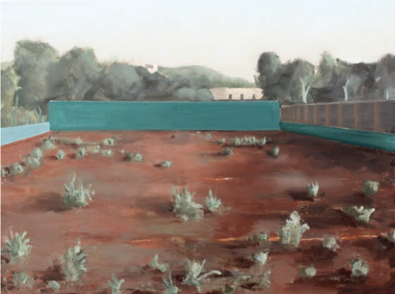
Verlassener Tennisplatz | 2021 | Öl auf Leinwand | 60x80 cm | VG Bild-Kunst, Bonn 2024 | Foto: Klaus Geigle

Seine leeren und verlassenem Tennisplätze erinnern wiederum an die Jahre der Pandemie, als viele Orte des alltäglichen Lebens leer und ungenutzt blieben. Der Künstler zeigt darin, wie die Natur solche ungenutzten Flächen für sich zurückerobernd und darauf floriert. In seiner neusten Werkgruppe verbindet er jene Tennisplätze mit einer Nachempfindung von Arnold Böcklins Gemälde Die Toteninsel aus den 1880er Jahren. Das bedeutende und gleichermaßen düstere Werk des Symbolismus wird dabei um ein surreal absurdes Element ergänzt und zugleich in die Gegenwart geholt.