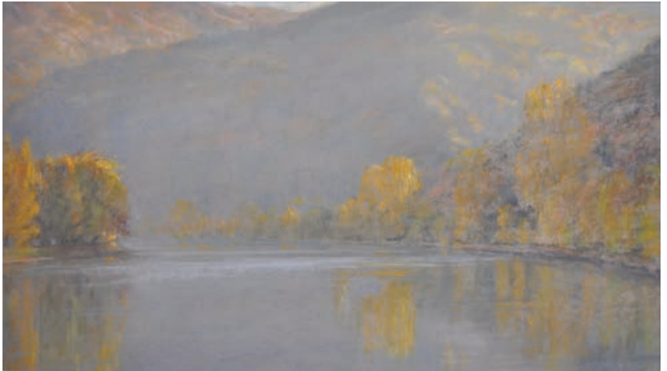
Rheinlache | 2011 | Pastell | 28x50 cm | VG Bild-Kunst, Bonn 2024