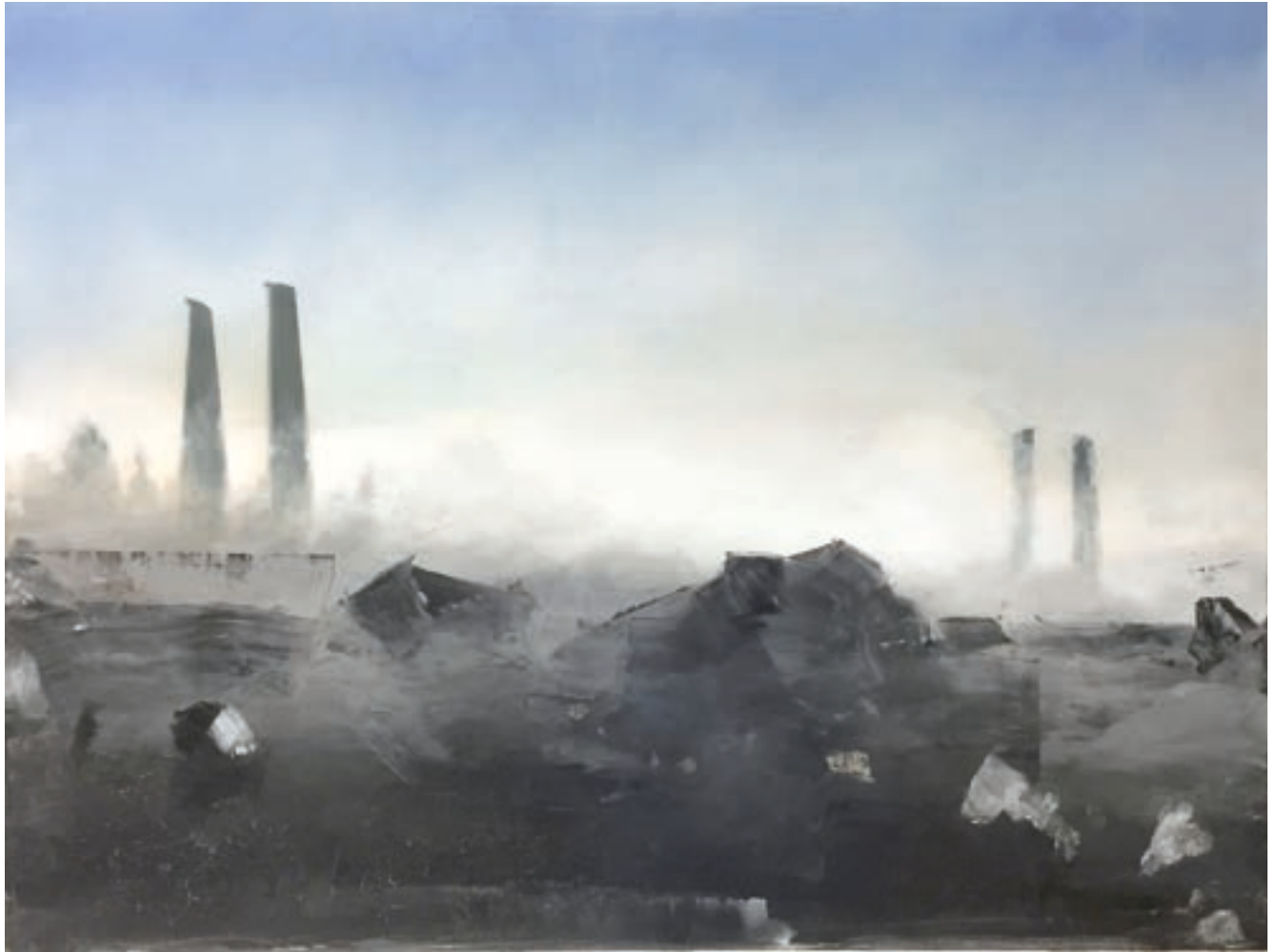
Kylo Ren – Betriebsausflug | 2023 | Öl und Vulkanasche auf Leinwand | 60x80 cm | VG Bild-Kunst, Bonn 2024

Klaus Geigle studierte Freie Kunst an der Kunstakademie Münster und absolvierte 2003 sein Studium als Meisterschüler bei Prof. Udo Scheel. Seitdem lebt und arbeitet er als freischaffender Künstler in Köln und Münster, erhielt zahlreiche Arbeitsstipendien in ganz Europa und nahm an vielen Ausstellungen teil. Seit 2015 lehrt er an der Fachhochschule für Architektur in Münster.