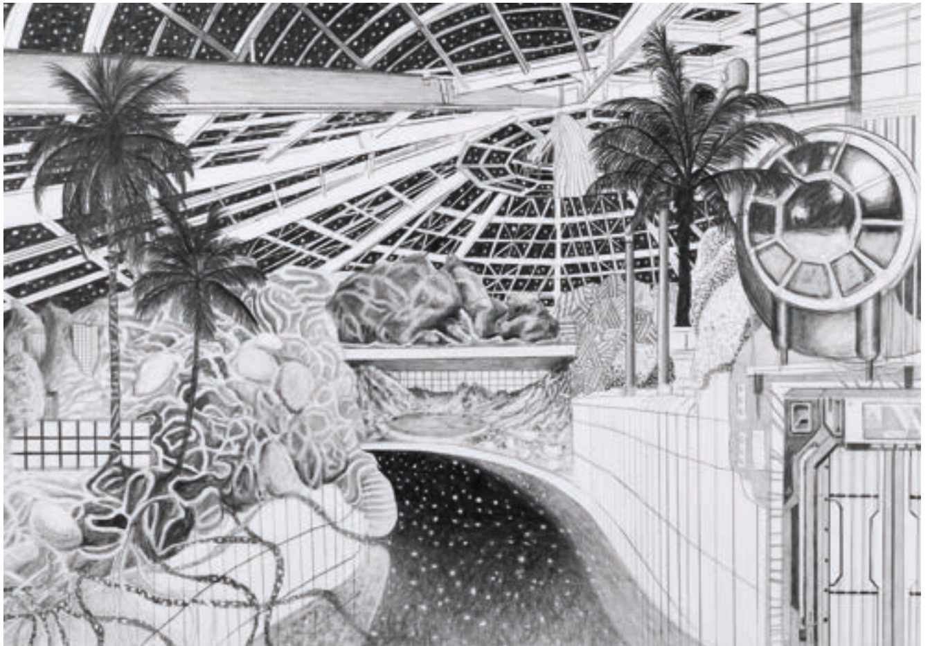
Spaceship (New Home) | 2022 | Bleistift auf Papier | 29,7x42 cm | Courtesy of the Artist | Foto: Kristin Albrecht