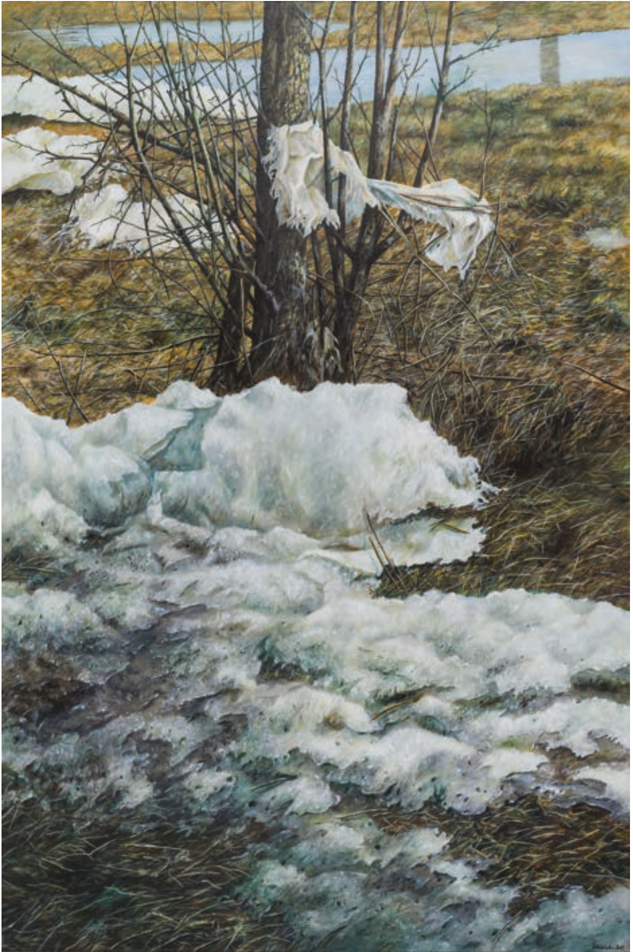
Eis 24 | 2012 | Acryl auf Leinwand | 120x80 cm | VG Bild-Kunst, Bonn 2024