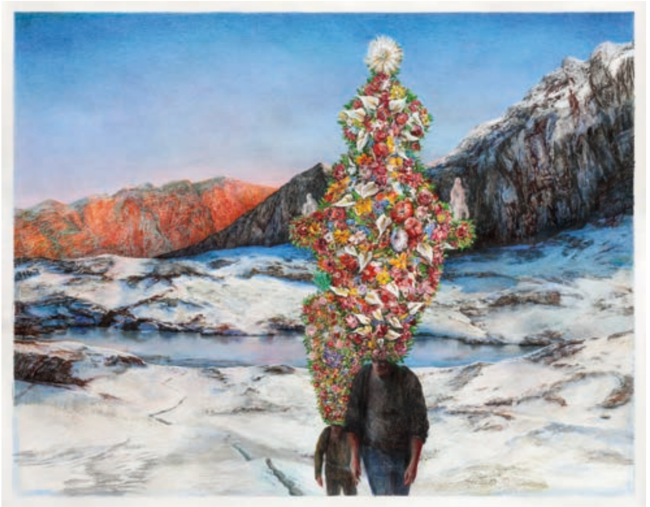
Frühling | 2020 | Farbstift und Pastellkreide auf Papier | 126 x 160 cm | VG Bild-Kunst, Bonn 2024