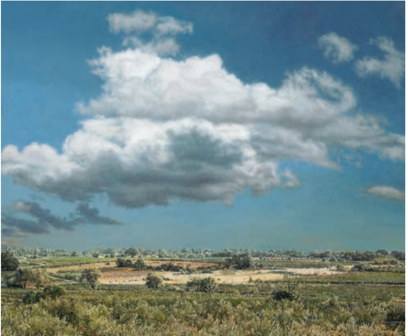
Lagamas | 2021 | Acryl auf Holz | 64x76 cm | VG Bild-Kunst, Bonn 2024 | Repro: Sascha Zuhl