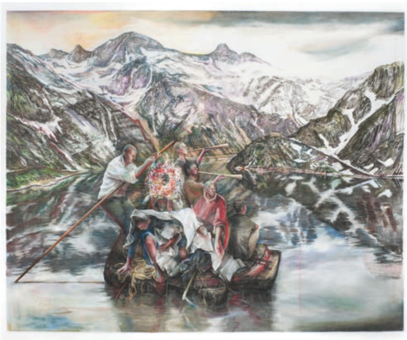
Überfahrt | 2014 | Farbstift und Pastellkreide auf Papier | 129 x 160 cm | VG Bild-Kunst, Bonn 2024

Die Landschaften Altschäfers sind bis ins kleinste Detail durchkonstruiert. Ausgehend von einem Gerüst aus Linien und Fluchtpunkten arbeitet die Künstlerin in präziser Kleinstarbeit. Nicht eine Linie ist zufällig gesetzt. Umso interessanter macht dies die Bildthemen ihrer unwirklich erscheinenden Landschaften, die offen lassen, was wirklich darin geschieht.