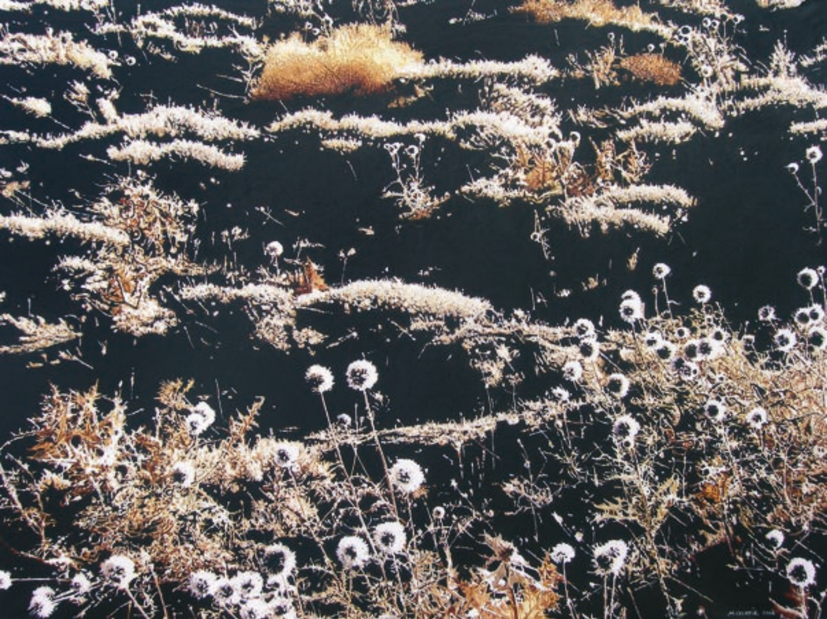
In der Spur der Schatten | 2006 | Acryl auf Leinwand | 150x200 cm | Courtesy the Artist | Foto: Mahmut Celayir