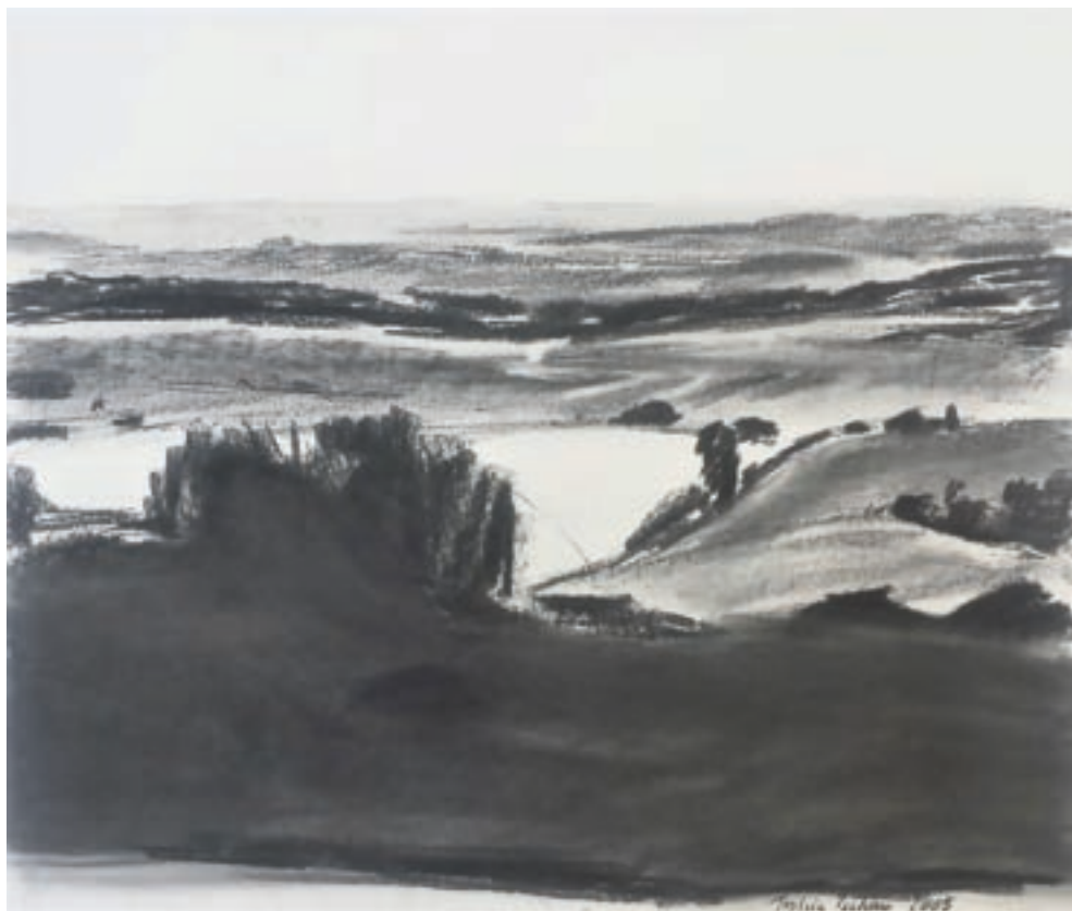
Pellenz | 2005 | Kohle auf Papier | 42x50 cm