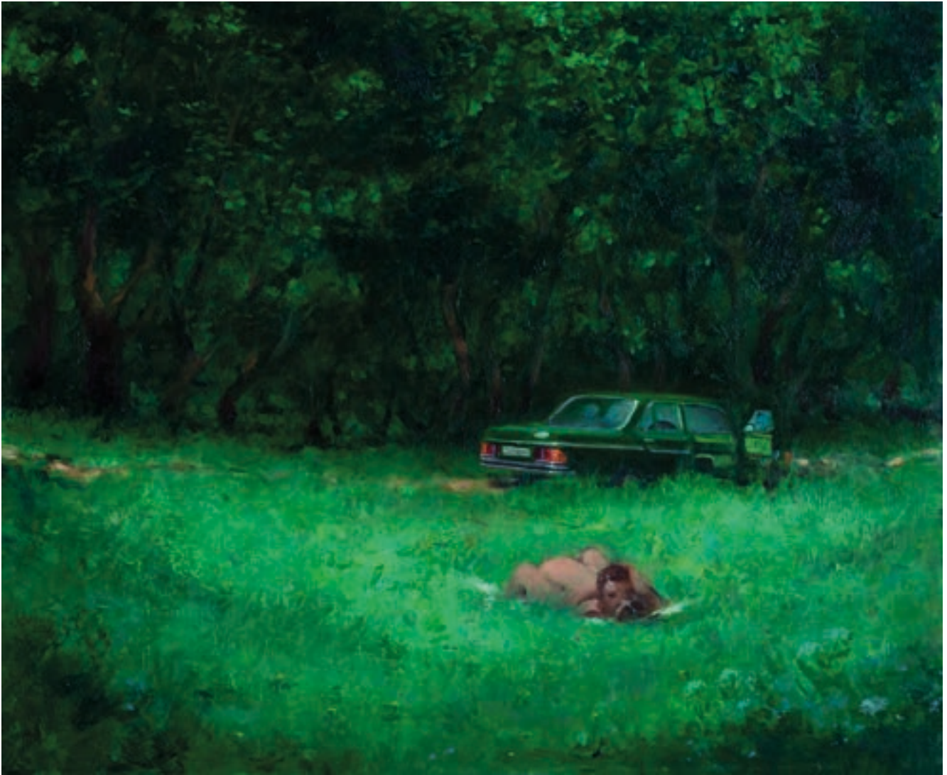
Mercedes 280 E | 2016 | Öl auf Karton | 30x37 cm | VG Bild-Kunst, Bonn 2024 | Foto: Johannes Hüppi