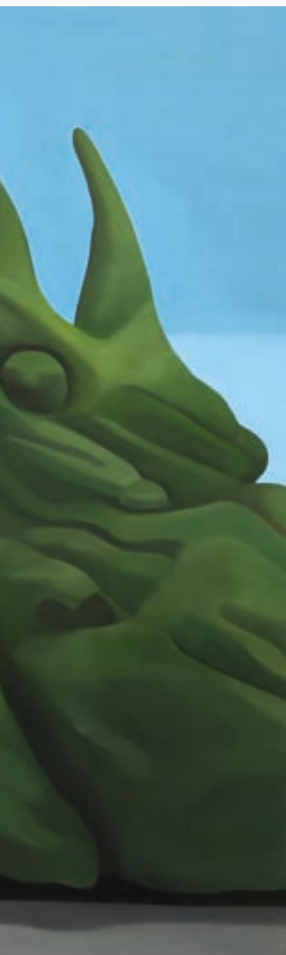
Kleines Haus mit Rollo | 2020 | Öl auf Leinwand | 40x60 cm | Courtesy the Artist | Foto: Lea Sprenger

Die Bildthemen aus Asien und Deutschland behandeln Orte, die konsequent durch den Menschen beeinflusst sind. Entweder durch geschaffene Strukturen, wie Gebäude, Laternen und Plakatwände, oder aber durch eine Natur, die vom Menschen gestaltet und in ein enges Korsett gezwängt wurde. Die Hecken und Bäume in Sprengers Bildern brechen aus dieser aufgezwungenen Form aus und erobern im Kleinen den vom Menschen durchkomponierten Raum zurück. Die Künstlerin fängt allerdings ebenso eine Natur ein, die in den ihr übergestülpten Formen verharrt. Akribisch zugeschnittene japanische Bäume und kreativ geformte Hecken machen diese Eingriffe des Menschen deutlich. Somit eröffnen ihre Kompositionen dem Betrachter die Möglichkeit, die eigene Wahrnehmung zu erweitern.